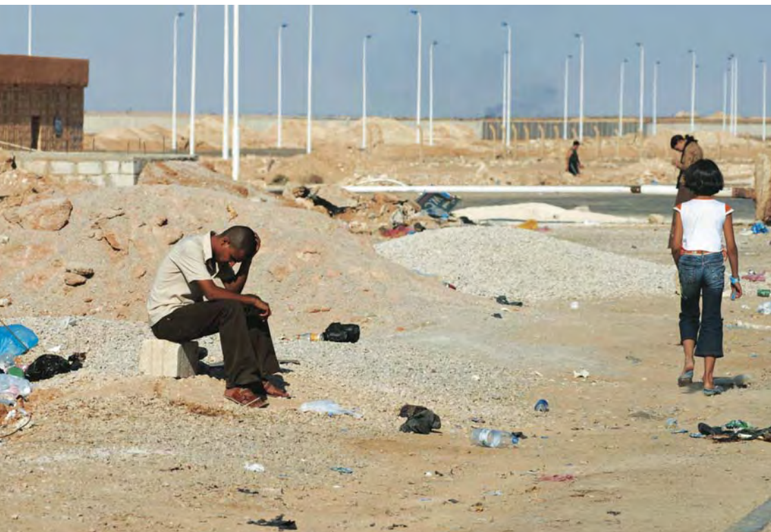
Dos de dos millones: refugiados iraquíes en la frontera con Siria.