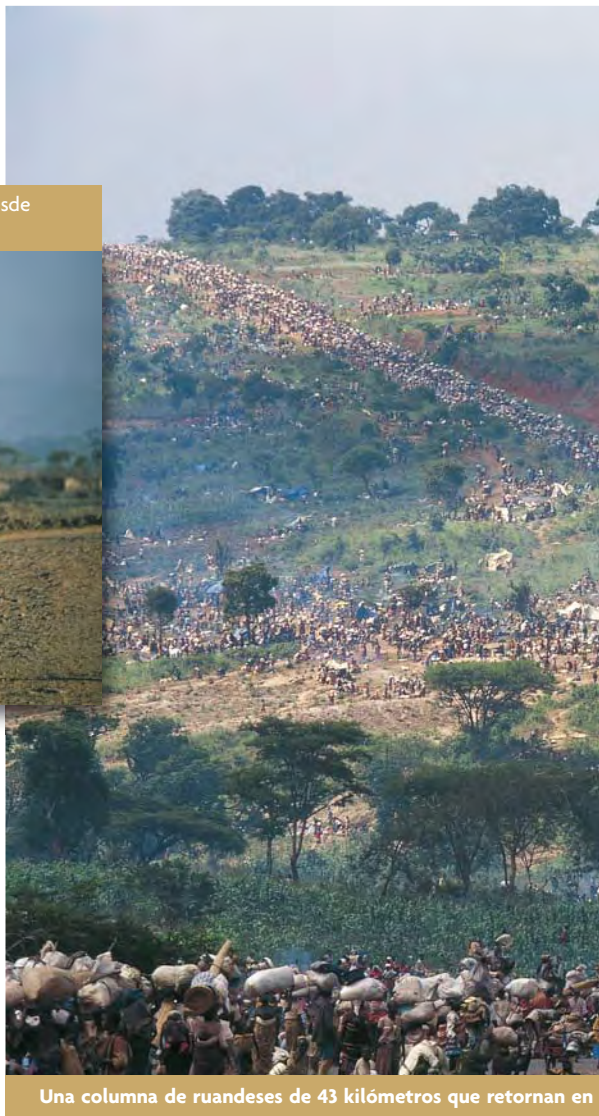
Una columna de ruandeses de 43 kilómetros que retornan en