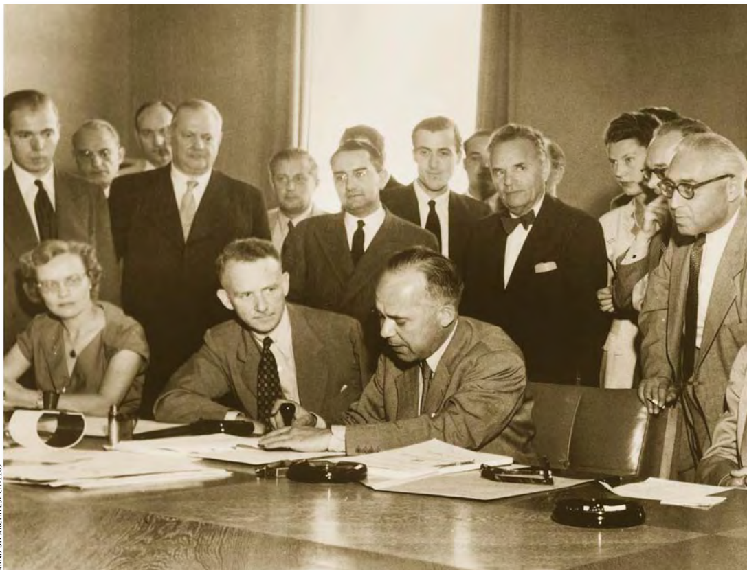
Los inicios: La Convención de 1951 sobre los refugiados fue aprobada y abierta a la firma el 28 de julio de 1951.